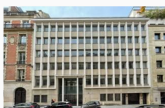
15 BEAUJON (75008 PARIS) ACTIF IMMOBILIER