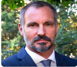
L'Aga Khan V Rahim al-Hussaini, Fondation Aga Khan.

Prince sans royaume, mais non sans influence, l'Aga Khan est à la tête d'un courant religieux connu pour accorder plus d'importance à la spiritualité qu'aux règles de la religion : « Les nizarites prônent un islam ouvert, qui n'impose pas de restriction alimentaire ou le port d'un vêtement à qui ne le souhaite pas », résumait-il dans Le Monde en février 2025. Lignée princière issue de l'ancien empire perse, la famille al-Hussaini – qui se transmet le titre d'Aga Khan – côtoie les têtes couronnées et les dirigeants